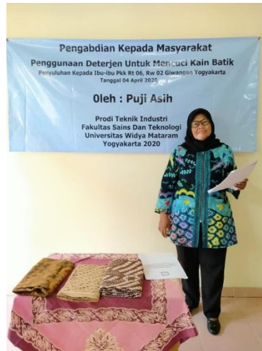
Gambar 1 : Penyampaian Materi Penggunaan Deterjen Untuk Mencuci Kain Batik.