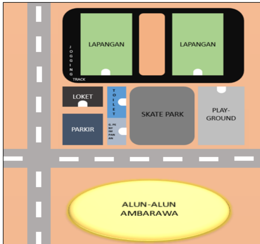
Gambar 1. Layout penambahan area sport center

Area lapangan untuk sport center nantinya dilengkapi dengan 2 lapangan bola, 1 loket dan ruang penyimpanan, jogging track , skate park , playground , 2 toilet, dan area parkir. Disamping area lapangan terdapat 2 bench untuk pemain dengan ukuran 0,75 x 5 meter. Selain itu, terdapat skate park dengan ukuran 15 x 8 m dan area jogging track di sekitar lapangan. Untuk dapat menarik minat anak kecil dan mengenalkan olahraga pada anak-anak, nantinya akan dibangun playground di sekitar lapangan. Beberapa fasilitas penunjang diantaranya pencahayaan dan 2 toilet. Gambaran layout penambahan area sport center dipaparkan dalam Gambar 1.